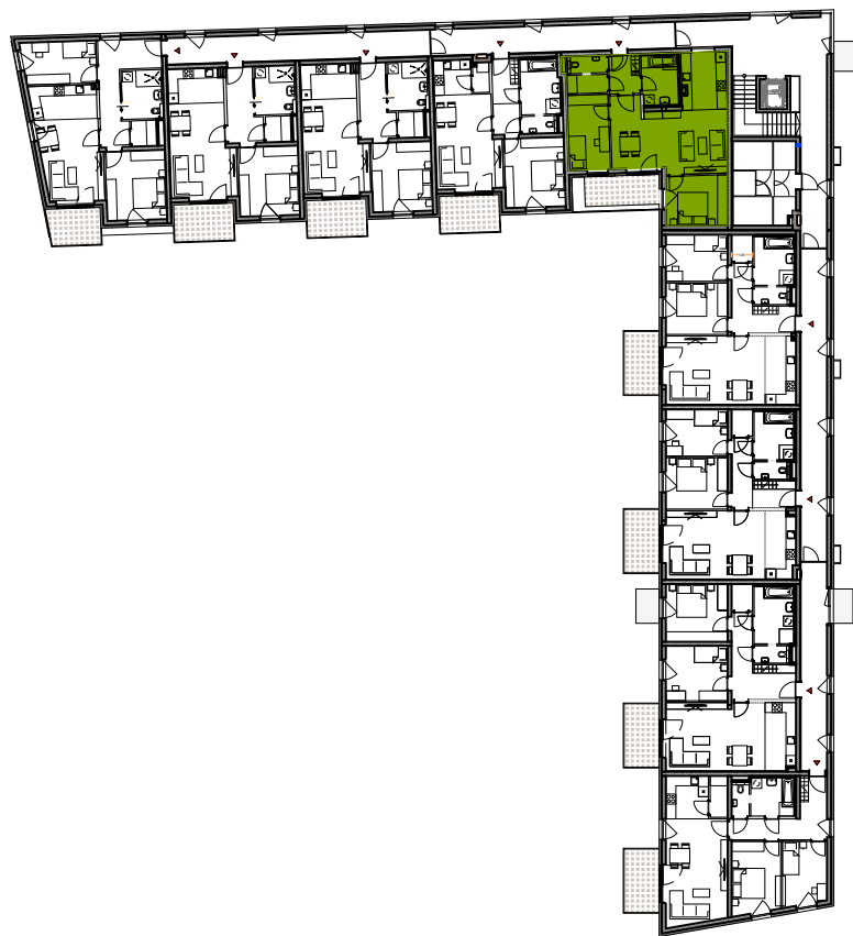
GESCHOSSÜBERSICHT 1.OBERGESCHOSS HAUS C