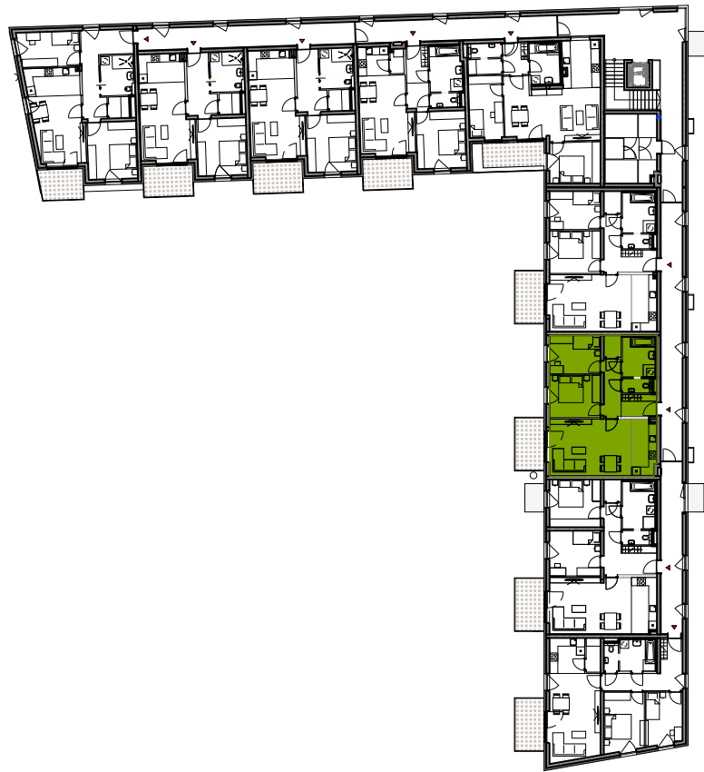
GESCHOßÜBERSICHT 1. OBERGESCHOSS HAUS C