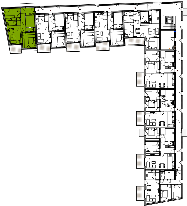
GESCHOSSÜBERSICHT 2.OBERGESCHOSS HAUS C