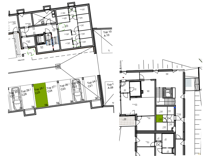
TIEFGARAGENPLATZ KELLERABTEIL 3.OG

h:\b-211_nh-wa_nied_2019\05_Ausführungspläne\12_Verkaufspläne\A-211_PO_P04_3OG_Haus_C.dwg