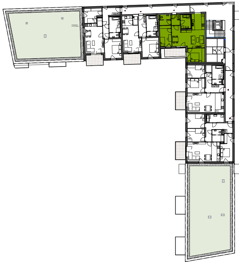
GESCHOßÜBERSICHT 3.OBERGESCHOSS HAUS C