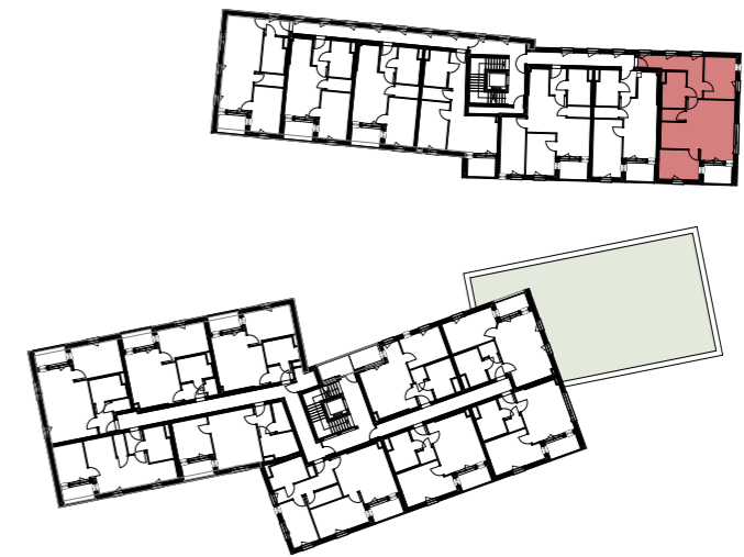
1. OBERGESCHOSS | ÜBERSICHT