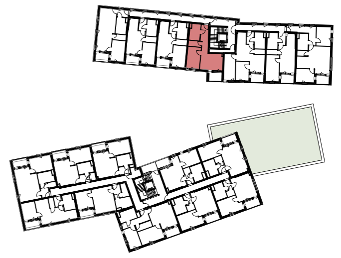
1. OBERGESCHOSS | ÜBERSICHT