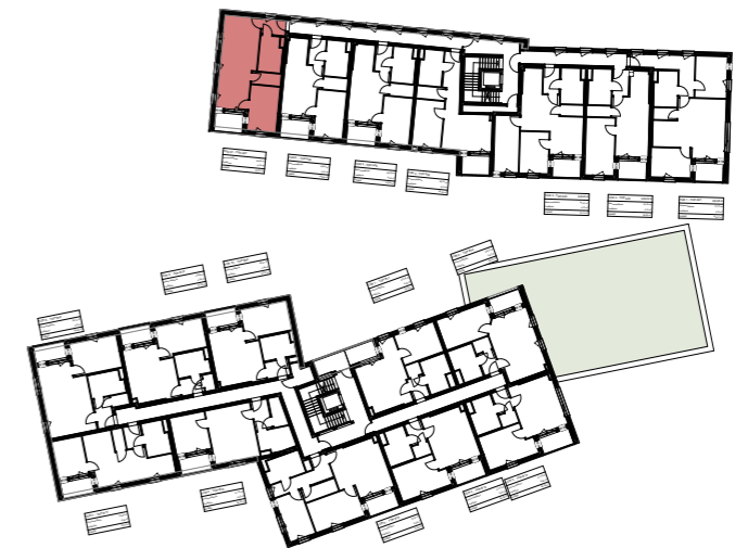
1. OBERGESCHOSS | ÜBERSICHT