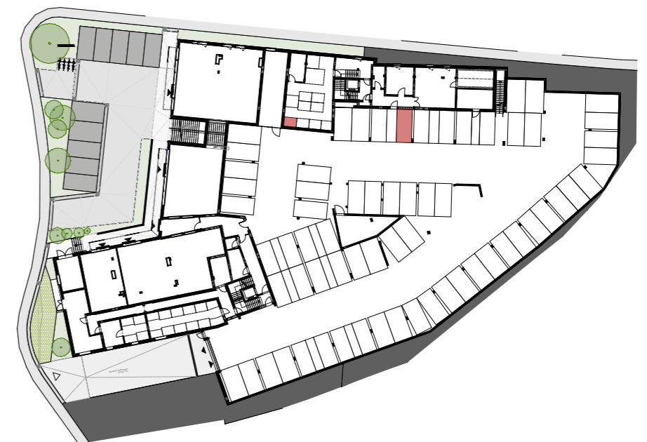
UNTERGESCHOSS | ÜBERSICHT